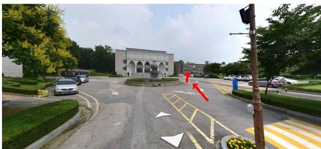
삼육대학교 가는길5: 회전교차로