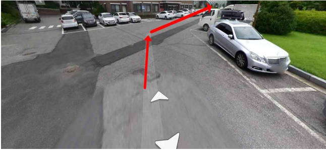
삼육대학교 가는길7: 온실방향