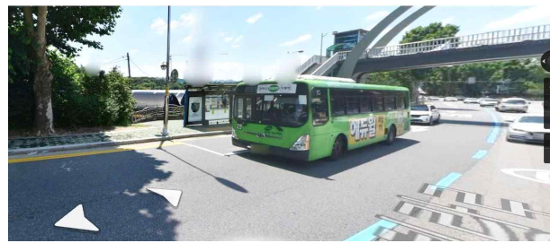
삼육대학교 가는길: 대중교통