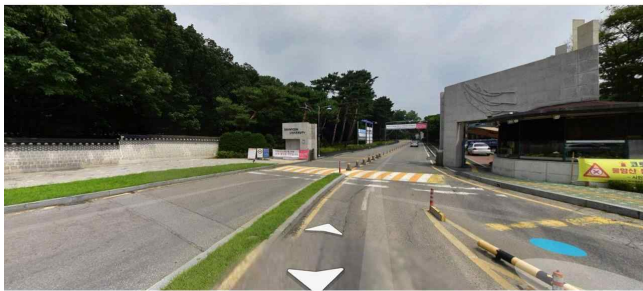
삼육대학교 가는길1: 삼육대학교 정문