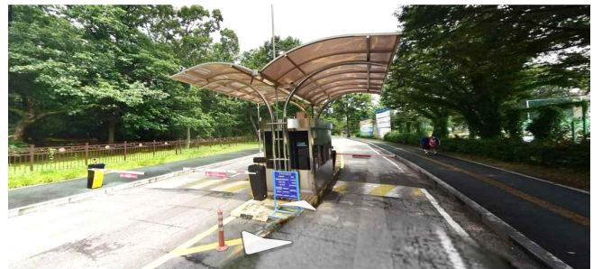
삼육대학교 가는길2: 정산소