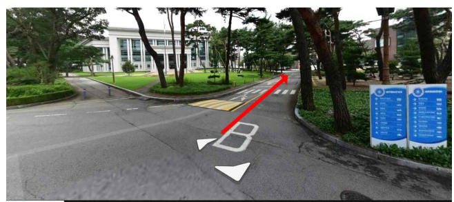
삼육대학교 가는길4: 정산소