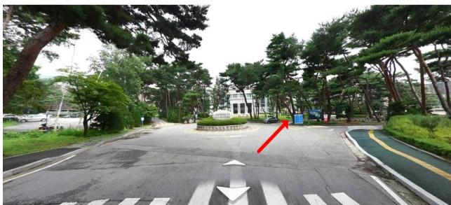
삼육대학교 가는길3: 회전교차로