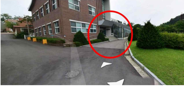
삼육대학교 가는길9: 온실입구